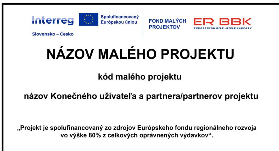
Obrázok 9 - Vzor pamätnej tabule